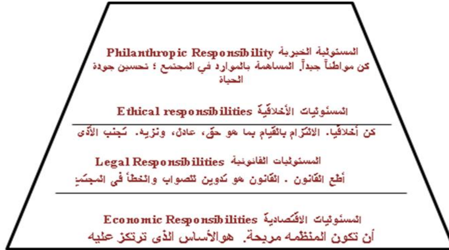
الشكل رقم (1) أبعاد المسؤولية الاجتماعية للشركات وفقا لنموذج (Carroll, 1991)